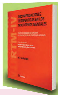
Coberta de l'RTM-IV >>