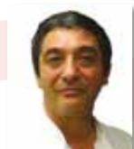
Trastorns Depressius Josep M a Peri

Els grups seran com a mínim de 4 terapeutes, fins a un màxim de 8, i el seu cost serà de 30 euros.