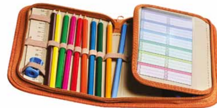
El curs que comença ve carregat de propostes