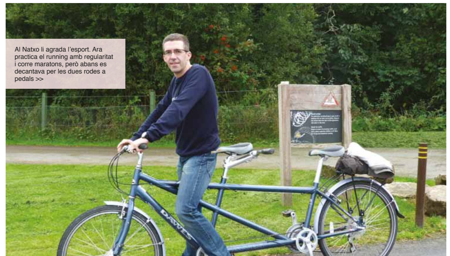
Al Natxo li agrada l'esport. Ara practica el running amb regularitat i corre maratons, però abans es decantava per les dues rodes a pedals >>

Per últim, el Natxo és molt gelós del seu temps lliure, i li costa renunciar-hi. Entre les seves aficions preferides destaca l'esport. De forma passiva, és un gran seguidor culer, el típic patidor. De forma més activa, si abans practicava esports d'equip i bicicleta, des de fa uns anys ha caigut en la febre del running i les maratons. Altres aficions menys practicades del que voldria són la lectura i la muntanya. Finalment, i encara que potser no seria ben bé una afició, els darrers anys dedica part del seu temps a estar molt al dia de la situació política del nostre país.