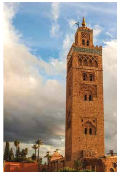
Imatge de la Mesquita Kutubia. El seu minaret és l'edifici més alt de la ciutat >>

Com molts ja sabeu, aquest any el congrés europeu de teràpia cognitivoconductual, que organitza cada any l'European Association of Behavior Cognitive Therapies (EABCT) es va allunyar una mica d'Europa i es va celebrar a Marràqueix, al Marroc. Aquesta era una aposta important per part de l'EABCT, donat que mai aquest congrés s'havia fet fora de les fronteres europees. I quin va ser el resultat? Doncs un èxit extraordinari, ja que a Marroc s'hi varen aplegar més de 1.300 representants de la "TCC" dels cinc continents (a l'Antàrtida encara no ha arribat la TCC, però doneu-li temps...). Des del punt de vista del contingut, al congrés s'hi varen poder veure/escollar algunes aportacions interessants en els camps de la integració entre neurociència i TCC, de les aproximacions terapèutiques centrades en les diferències culturals i un especial èmfasi en com millorar l'entrenament dels terapeutes.