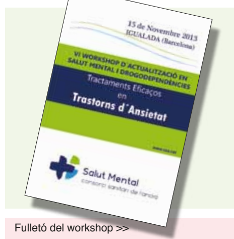
Fulletó del workshop >>

http://salutmental.csa.cat/index.php?md=articles&accio=mostra&id=2636&lg=cat&vista_previa=1