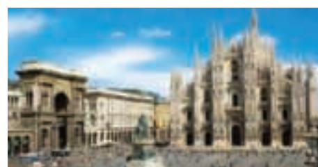
El Duomo a Milà >>

EABCT 40th Annual Congress. El congrés anual de l'associació europea de TCC tindrà lloc entre els dies 7 i 10 d'octubre de 2010 a Milà, Itàlia. Ja podeu consultar una versió preliminar del programa científic a la pàgina del congrés: www.eabct2010-milan.it En els propers info-scritcs anireu rebent més informació sobre aquesta important trobada.