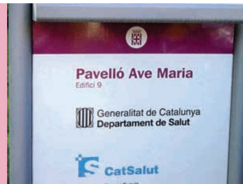
L'SCRITC és presentada a la Generalitat

•"Trastorno de ansiedad: crisis de angustia y agorafobia"