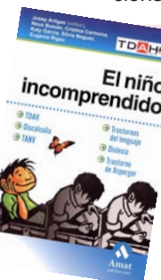
Coberta del llibre "El niño incomprendido" >>