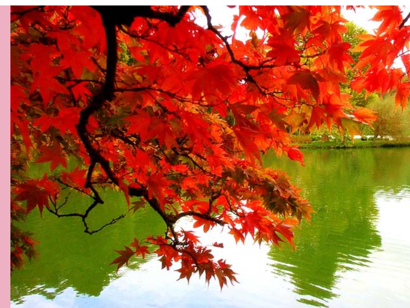
La tardor ens porta novetats

•XXV aniversari de la Unitat de Teràpia de Conducta