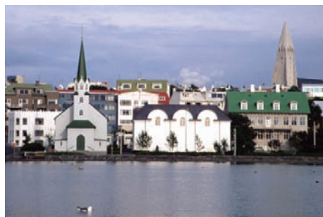
El proper congrés de l'EABCT tindrà lloc a Reykiavik a finals d'agost >>

assistiren, quan de tots és coneguda l'atracció que sol despertar aquesta trobada entre els scritcencs/enques . Però, no patiu (dit de manera wellsiana, no us deixeu arrossegar per preocupacions de tipus I), perquè ja s'està preparant el proper congrés europeu, que anirà ben farcit de figures del món de la "nostra" teràpia i que tindrà com a seu un lloc tan atractiu com poc conegut: Islàndia. El congrés de la EABCT a Reykiavik es farà a finals del mes d'agost de l'any que ve i, amb la "prevenció" com a tema central, promet molt tant per la qualitat de les estrelles convidades com per l'atractiu del lloc. I ja estan confirmades les properes seus del congrés europeu.