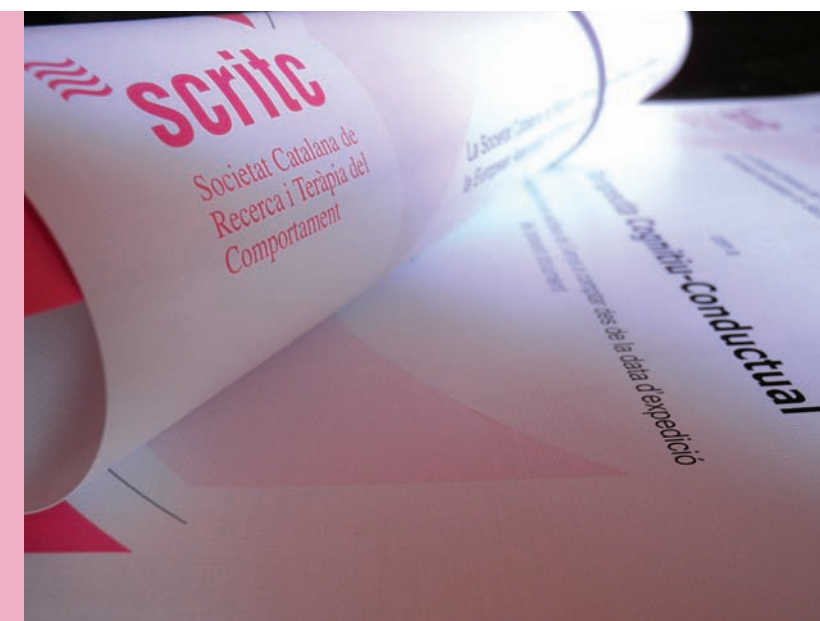
A finals d'any acaba la via transitòria per a ser acreditat

Edita: Societat Catalana de Recerca i Teràpia del Comportament (SCRITC). Apartat de correus núm. 11, 08193 Bellaterra (Barcelona). Tel. 618 62 23 23. E-mail: info@scritc.org