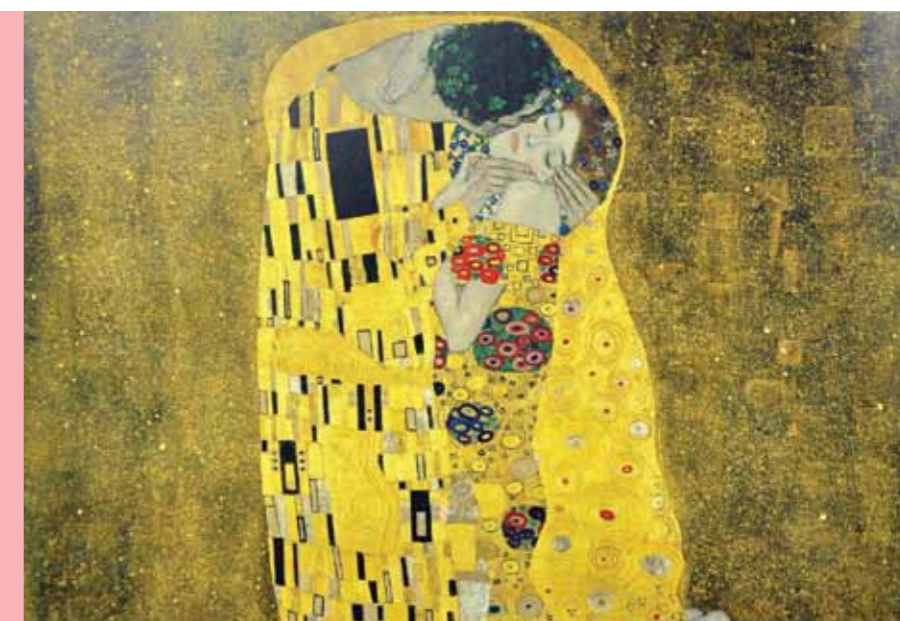
Detall de l'obra 'El petó' de Gustav Klimt