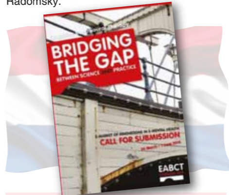
A dalt el póster del Congrés europeu 2014. A sota una imatge del Parlament holandès a La Haia >>