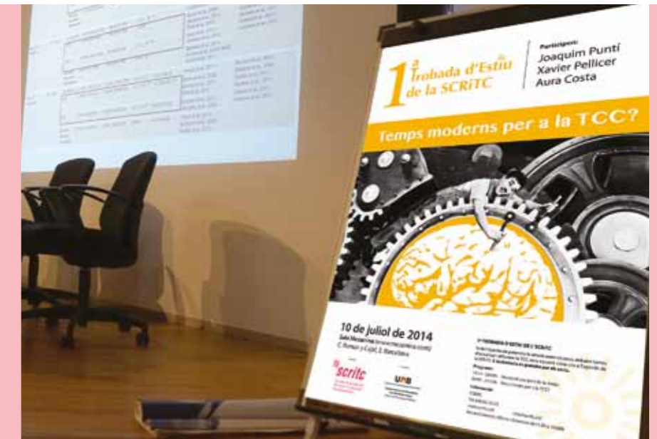
El póster de la 1a Trobada d'Estiu de l'SCRiTC a la sala del CCCB on va tenir lloc la Jornada