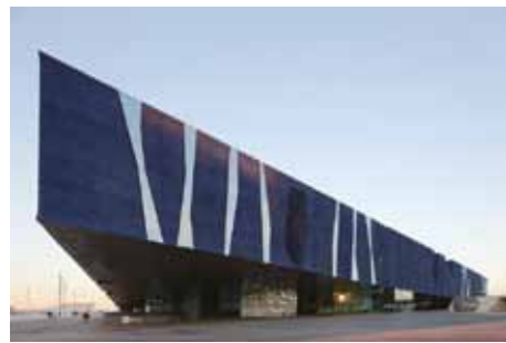
L'any 2007 l'edifici Fòrum va ser la seu del 5è WCBCT, organitzat per l'SCRITC >>

La Junta ha presentat de nou la candidatura per tal d'organitzar el Congrés Europeu de l'EABCT de l'any 2022. Estem treballant per tenir més clars quin són els criteris que ens poden donar avantatge a l'hora de poder obtenir l'encàrrec d'organitzar el congrés, que passen per tenir una seu més econòmica i per donar avantatges als companys que venen de països on la TCC no està prou desenvolupada.