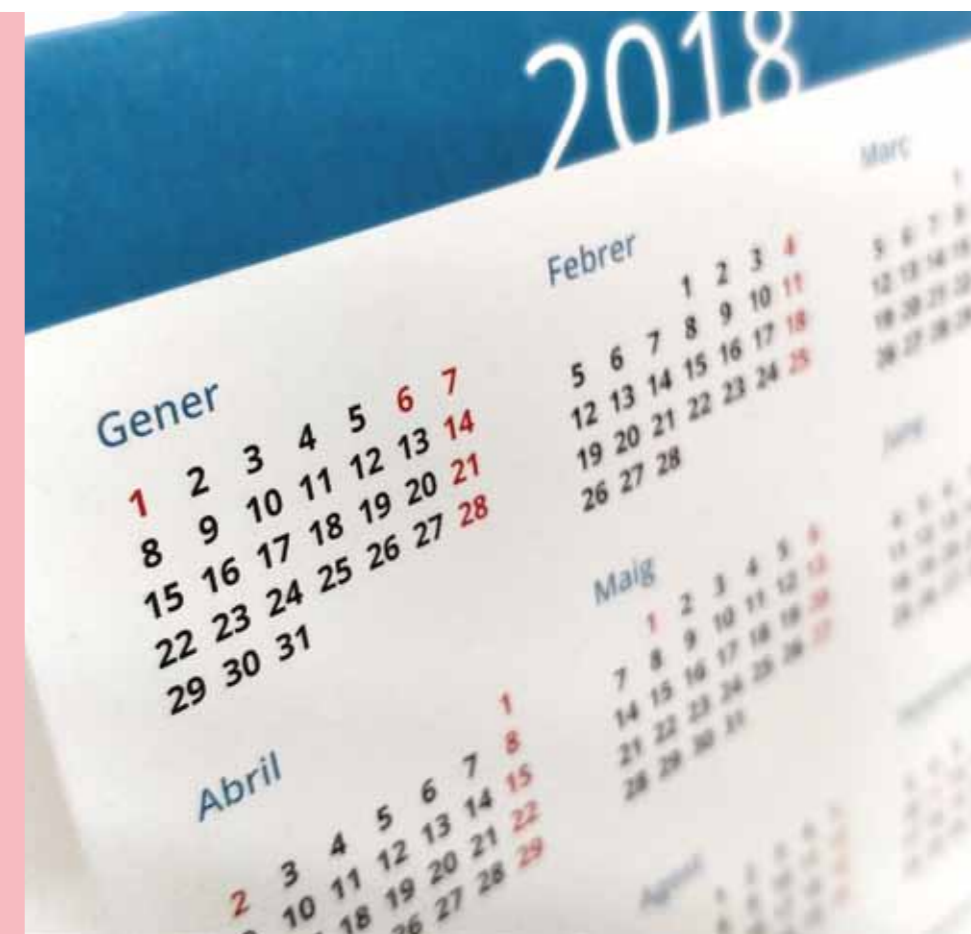
Desitgem un 2018 positiu i pròsper per a la nostra societat i tots els que l'integrem

Edita: Societat Catalana de Recerca i Teràpia del Comportament (SCRITC). Apartat de correus núm. 11, 08193 Bellaterra (Barcelona) Tel. 618 62 23 23. E-mail: info@scritc.cat InfoSCRITC (Ed. impr.): ISSN 2385-734X InfoSCRITC (Internet): ISSN 2385-7331 Dipòsit Legal: B11765-2015