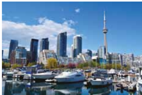
Skyline de la ciutat de Toronto vist des del llac Ontario >>

La ciutat de Toronto al Canadà acollirà aquesta trobada els dies 11 i 12 de juliol de 2018. Si en voleu saber més entreu a: //goo.gl/AMZ8rm .