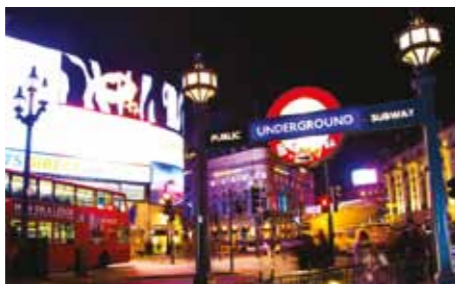
Vista nocturna de Picadilly Circus, la famosa plaça del West End de Londres >>

Si desitgeu més informació de la trobada podeu visitar a Internet l'adreça següent: waset.org/conference/2018/02/london/ICSCSP