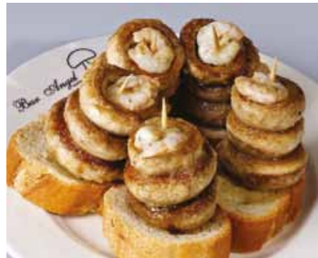
Pinxo de xampinyons i gambes, un clàssic de la Calle Laurel de Logronyo >>

El 9è Congrés Internacional de Psicologia i Educació se celebrarà a Logronyo del dia 21 al 23 de juny d'aquest any.