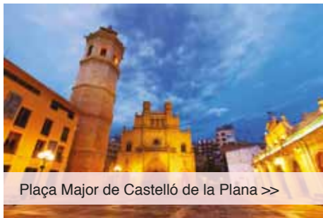
Plaça Major de Castelló de la Plana >>

El Col·legi Oficial de Psicòlegs de la Comunitat Valenciana organitza el curs 'Actualització en teràpia cognitiva para los trastornos de ansiedad' que tindrà lloc el dia 13 de març a la seu de Castelló del Col·legi.