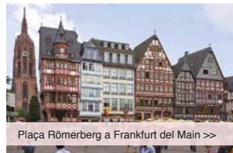
Plaça Römerberg a Frankfurt del Main >>

La International Conference on Depression, Anxiety and Stress Management arriba enguany a la seva 4a edició. Tindrà lloc a Frankfurt els dies 10 i 11 de maig i en trobareu més informació a: Stress2018 .